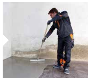
Bred ut beläggningen