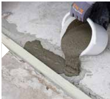
Bakfyll tröskeljärnet med flytbart bruk

En sluttande ramp på utsidan av PCI Nanocret R4 PCC hjälper till att överbrygga höjdskillnader på upp till 50 mm och skyddar tröskeln mot stötbelastning.