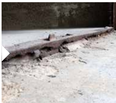
Jämna ut höjdskillnaden mot tröskeln med en ramp