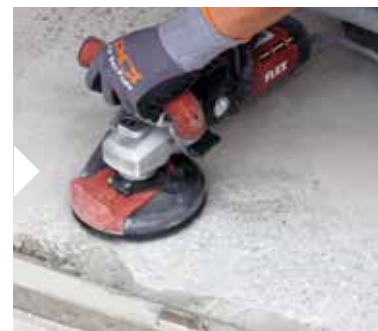
Efterbearbeta hörn och vinklar