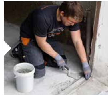
Alternativt kan man spackla med bruk